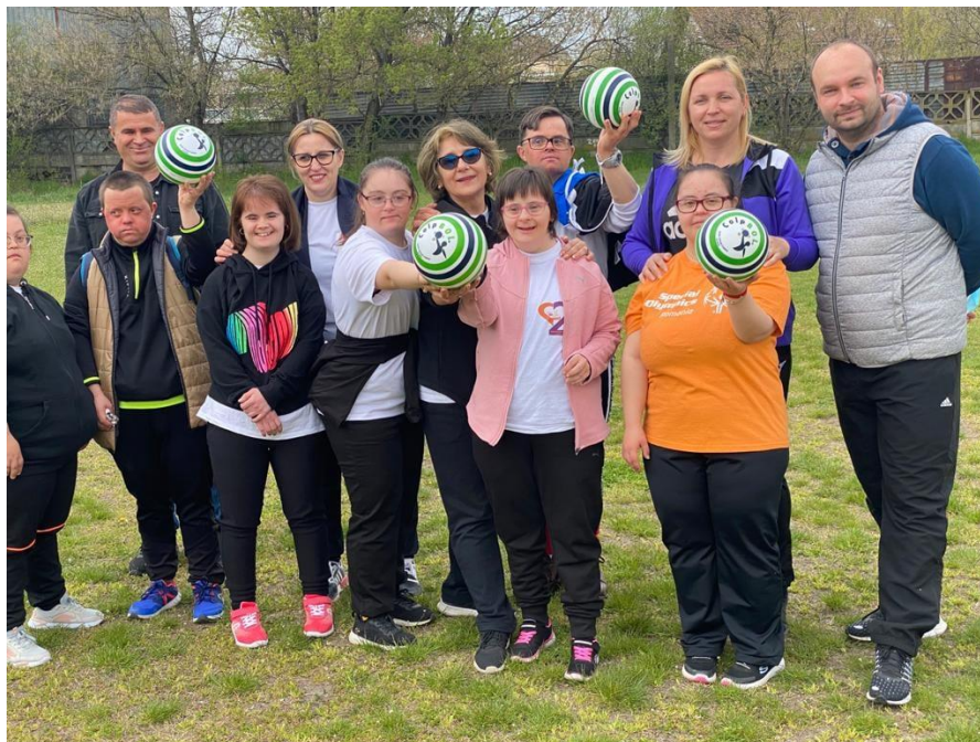
SESIUNE DE CO-CREAȚIE ÎN ROMÂNIA susținută de ALDO-CET și Universitatea din Craiova.