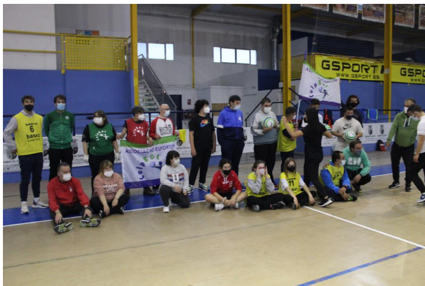
SESIUNE DE CO-CREAȚIE ÎN SPANIA susținută de COPAVA și Associació Esportiva COLPBOL.

Acest proiect este realizat cu sprijinul financiar al Comisiei Europene.