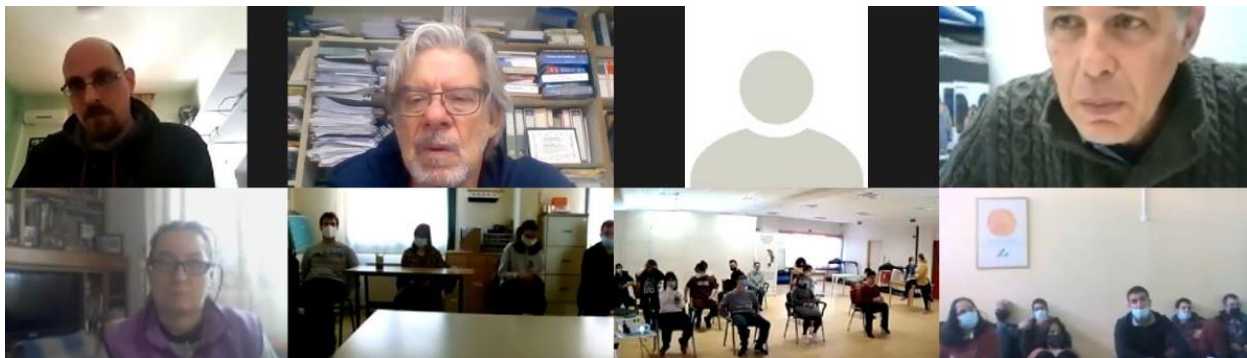
SESIUNE DE CO-CREAȚIE ÎN GRECIA susținută de EDRA și NKUA.